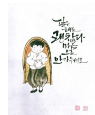
● 실수해도 괜찮아