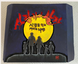
● 사랑하며 살자