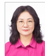
초대작가 하운 강 귀 이