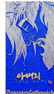
● 아버지 뜻대로 하소서