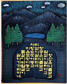
● 정산은 나를보고