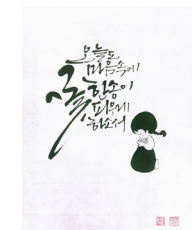
● 오늘도 꽃한송이 피우게 하소서