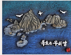
● 독도는 우리땅