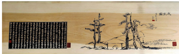
● 추사김정희 세한도