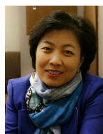
작품지도 여울 안 유 진