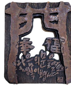
● 행복의 문