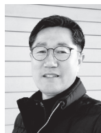
작품지도 목천 김 병 찬