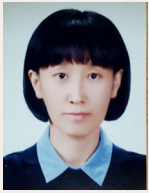
소월 채 화 신