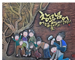
● 창문너머 어렵곳이