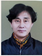
어봉 유 향 복