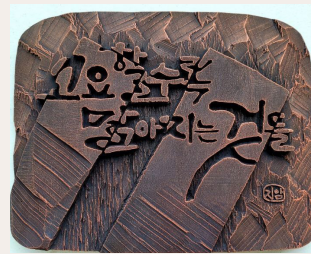
● 고요할수록 맑아지는 것들