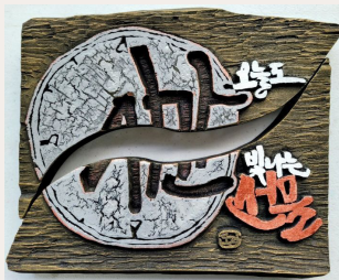
● 시간, 오늘도 빛나는 선물