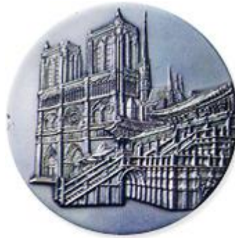
한국 한불수교 100주년 기념메달